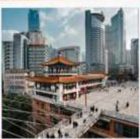
ตึกหุขิง (ตึก 22 ชั้น)