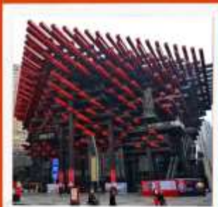
พิพิธภัณฑ์ศิลปะฉงชิ่ง