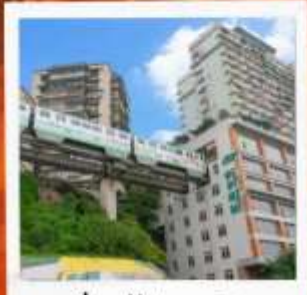
นั่งรถไฟทะลุตึก