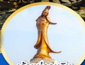
เจ้าแม่กวนอิม ริมทะเลมาเก๊า