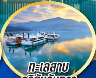
ทะเลสาบ สุริยันจันทรา

เมนูพิเศษ!! ต้มชาสโตลฮ่องกง เป่าอ้อ+ไวน์แดง, ปลาประธนาธิบดี