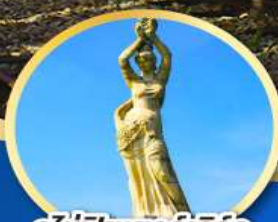
จูไห่ฟิชเชอร์เทิร์ล