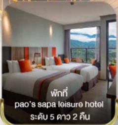
พักที่ pao's sapa leisure hotel ระดับ 5 ดาว 2 คืน