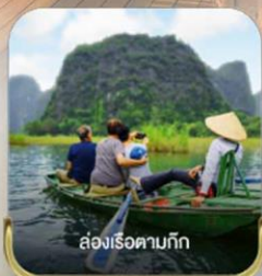
ล่องเรือตามก๊ิก