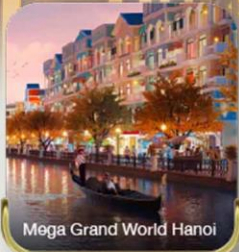
Mega Grand World Hanoi