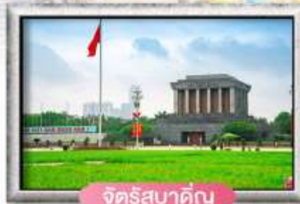
จัตุรัสบาต๋ิง