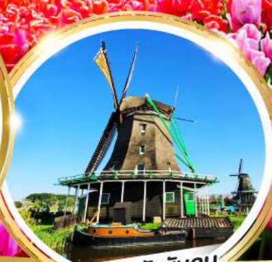
หมู่บ้านกังหันลม