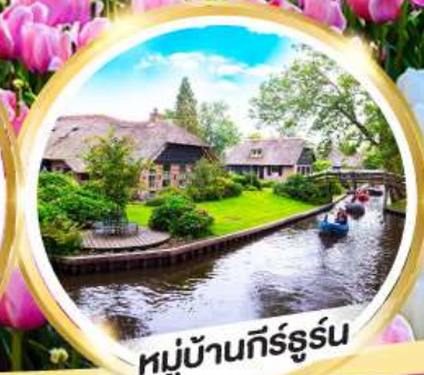
หมู่บ้านกัร์ธูร์น