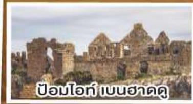
ป้อมไอร์ก์ เบนฮาดดู