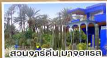
สวนจาร์ดินมาจอแรล