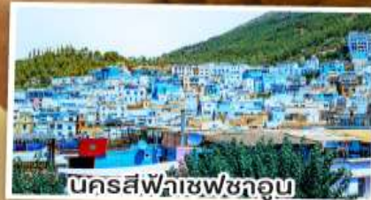
นครสีฟ้าเซฟซาอูน