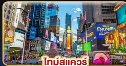
ไทม์สแควร์