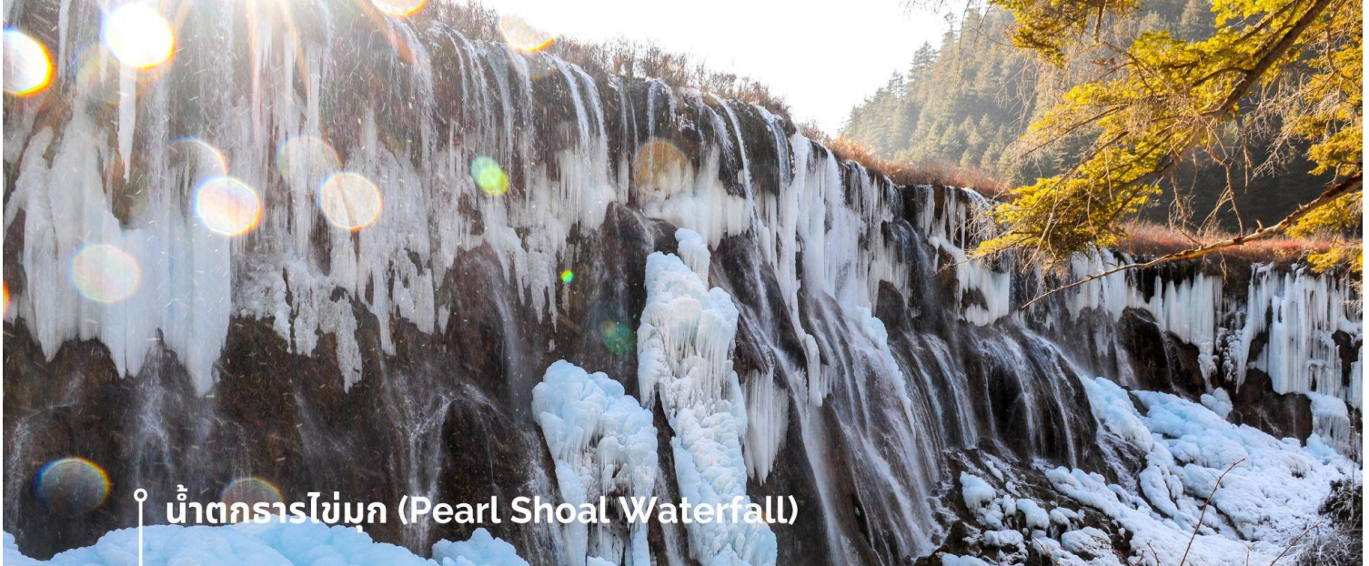
น้ำตกธารไข่มุก (Pearl Shoal Waterfall)

หรือ น้ำตกนุริอูลาง (Nuo Ri Lang Waterfall) ถือเป็นน้ำตกที่ใหญ่ที่สุดในจิวจ้ายโกว มีความสูง 40 เมตร กว้าง 310