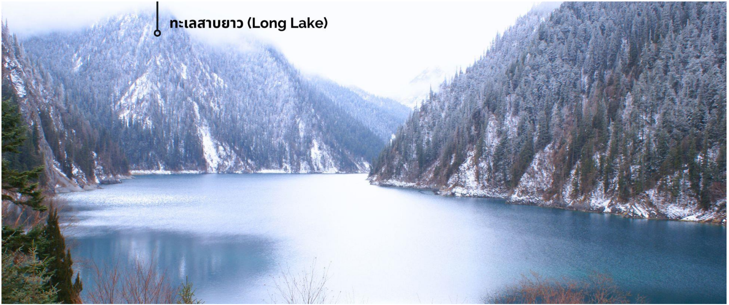
ทะเลสาบยาว (Long Lake)

ทะเลสาบที่ใหญ่ที่สุด สูงที่สุด และลึกที่สุดในจิวจ้ายโกว ด้วยเนื้อที่กว่า 581 ไร่ ความยาวกว่า 7 กิโลเมตร และลึกถึง 103 เมตร ทอดตัวโค้งเป็นรูปพระจันทร์เสี้ยว เนื่องจากหิมะบนภูเขาละลายลงมา น้ำในทะเลสาบสีฟ้าสวยงาม ล้อมรอบด้วยยอดเขาสูงชัน และต้นไม้ใหญ่ที่ปกคลุมด้วยหิมะ งดงามราวหลุดออกมาจากภาพวาด ความพิเศษในช่วงฤดูหนาว ทะเลสาบจะกลายเป็นน้ำแข็งหนากว่า 60 เซนติเมตร ทำให้นักท่องเที่ยวนิยมมาเล่นสเก็ตน้ำแข็งกันเป็นจำนวนมาก