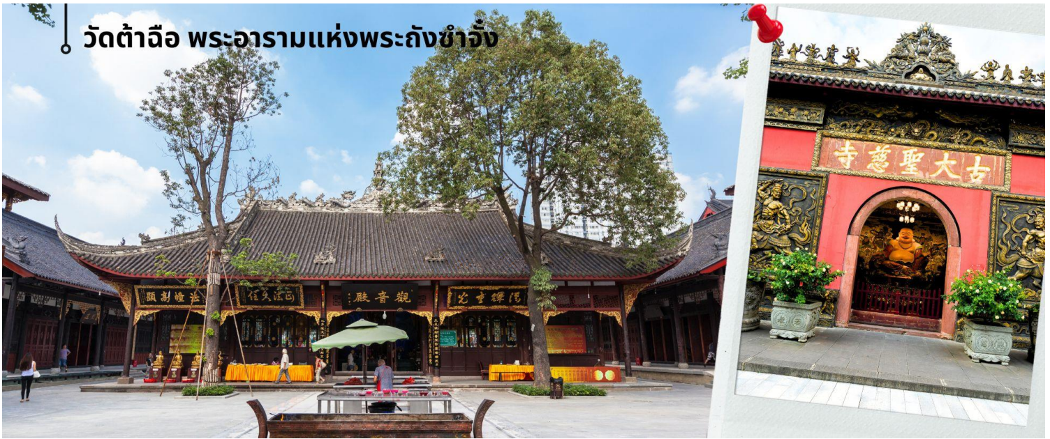
วัดต้าฉือ พระอารามแห่งพระถังซำจั๋ง

นำท่านชม วัดต้าฉือ พระอารามแห่งพระถังซำจั๋ง ใจกลางนครเฉิงตู พระถังซำจั๋ง ได้รับการสรรเสริญว่าเป็นผู้มีความเพียร และมีชื่อเสียงมายาวนานกว่า 1,400 ปี และยังได้รับการยกย่องว่าเป็น พระไตรปิฎกแห่งราชวงศ์ถัง พุทธประวัติของพระถังซำจั๋งถูกจารึกในสถานที่ต่างๆมากมาย รวมไปถึงได้ถูกกล่าวถึงในจดหมายเหตุหลายเล่ม ตามเส้นทางการเดินทางแห่งความเพียรของท่าน รวมทั้งมีพระอัฐิของท่าน ประดิษฐานอยู่ในพระอารามของนครนานจิง และที่ทะเลสาบ