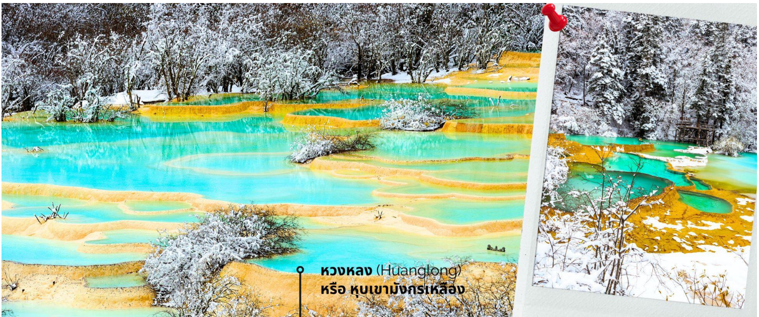
หวงหลง (Huanglong) หรือ หุบเขามังกรเหลือง

หวงหลง (Huanglong) หรือ หุบเขามังกรเหลือง (รวมค่ากระเช้าขึ้น-ลง หวงหลงและรถแบดเตอร์) ที่ได้รับการขึ้นทะเบียนเป็นมรดกโลก รายล้อมไปด้วยแอ่งน้ำสีฟ้าจำนวนนับไม่ถ้วน และภูเขาสูงใหญ่สลับซับซ้อน อุทยานหวงหลง (Huanglong Scenic and Historic Interest Area) หรือ หุบเขามังกรเหลือง แหล่งธรรมชาติที่อุดมสมบูรณ์บนเทือกเขา Minshan Mountains มีระบบนิเวศที่หลากหลาย ทั้งน้ำพุร้อน น้ำตก แอ่งน้ำหินปูน รวมถึงเป็นแหล่งของพืชพรรณนานาชนิด และสัตว์ป่าใกล้สูญพันธุ์อย่าง แพนด้ายักษ์ และ ลิงจุกเขดสีทอง เป็นต้น ที่สำคัญยังมีทัศนียภาพที่สวยงามที่ราวกับเป็นดินแดนสวรรค์ ด้วยคุณสมบัติเหล่านี้ อุทยานหวงหลงจึงได้รับการขึ้นทะเบียนเป็นมรดกโลกโดย