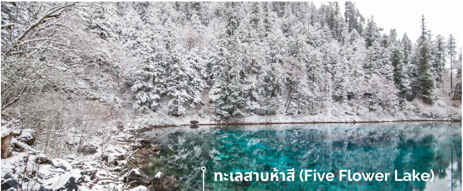
ทะเลสาบห้าสี (Five Flower Lake)

หนึ่งในจุดที่สวยงามและนักท่องเที่ยวแห่มาเยี่ยมชมเยอะที่สุด ตั้งอยู่ที่ความสูงเหนือระดับน้ำทะเลประมาณ 2,472 เมตร น้ำลึกประมาณ 5 เมตร น้ำใสจนเห็นพื้นด้านล่างของทะเลสาบ สีของผิวน้ำสวยงามแปลกตา โดยเฉพาะเมื่อยามแสงอาทิตย์สาดส่องกระทบผิวน้ำ สีของน้ำในทะเลสาบจะสะท้อนเป็นสีส้มถึง 5 เฉดสี สวยงามสะกดตา ซึ่งสาเหตุที่ทำให้เกิดสีส้มต่างๆ นี้มาจากการสะสมของแร่ธาตุ และพืชน้ำชนิดต่างๆ โดยจะมีสีส้มแตกต่างกันไปตามฤดูกาลและ