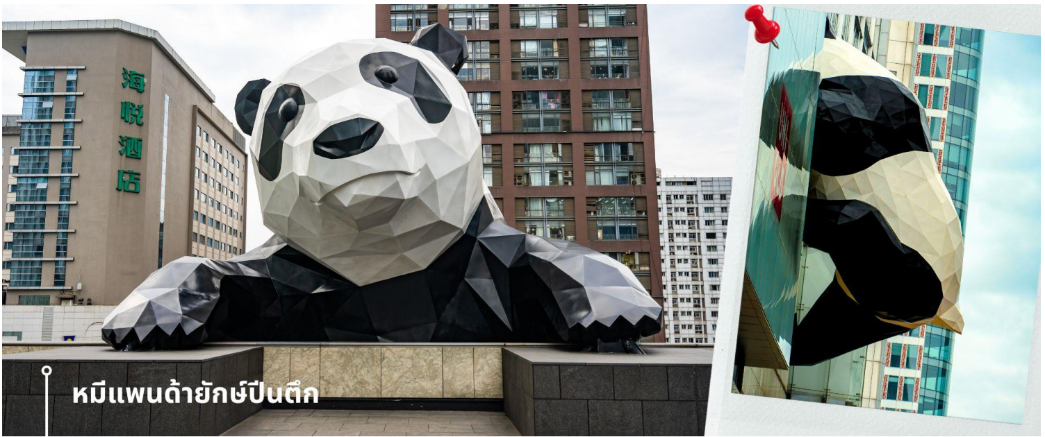
หมีแพนด้ายักษ์ป็นติก

จากนั้นนำท่านชมความน่ารัก อันเป็นเอกลักษณ์ของมหานครเฉิงตู นั่นคือ หมีแพนด้ายักษ์ป็นติก ประติมากรรมที่ชื่อว่า "I Am Here" ซึ่งเป็นหมีแพนด้ายักษ์ที่ตั้งอยู่ที่ IFS (International Finance Square) ในเมืองเฉิงตู ประติมากรรมนี้มี