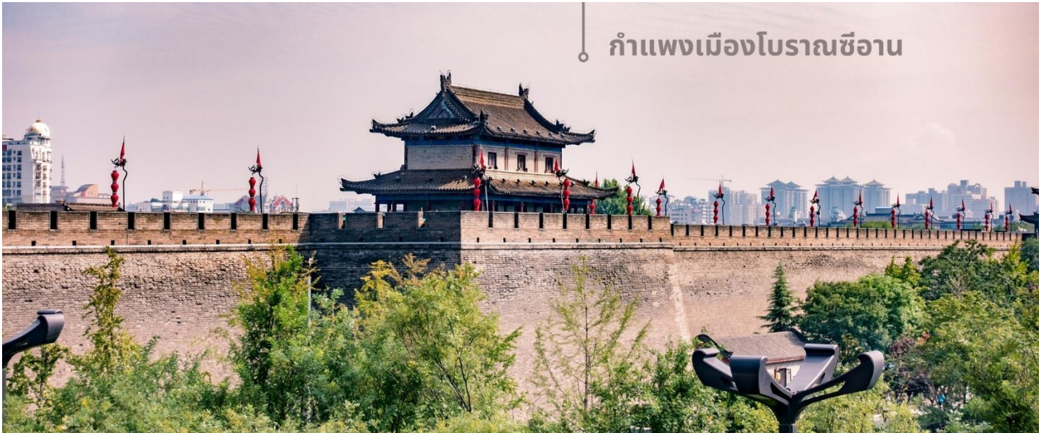
กำแพงเมืองโบราณซีอาน

จากนั้นนำท่านเที่ยวชม กำแพงเมืองโบราณซีอาน เป็นหนึ่งในกำแพงเมืองโบราณที่สมบูรณ์ที่สุดในประเทศจีน สร้างขึ้นในยุคราชวงศ์หมิง (ประมาณปี ค.ศ. 1370) ปัจจุบันมีอายุเก่าแก่กว่า 654 ปี มีความยาวประมาณ 13.7 กิโลเมตร ล้อมรอบใจกลางเมืองซีอาน ซึ่งเคยเป็นเมืองหลวงในยุคโบราณ กำแพงมีความสูง 12 เมตร และกว้างราว 12-15 เมตร มากพอสำหรับการเดินเล่นหรือขี่จักรยานชมวิวดูได้เลยทีเดียว นอกจากนี้ยังมีหอคอยและประตูเมือง 4 ด้านที่น่าประทับใจ