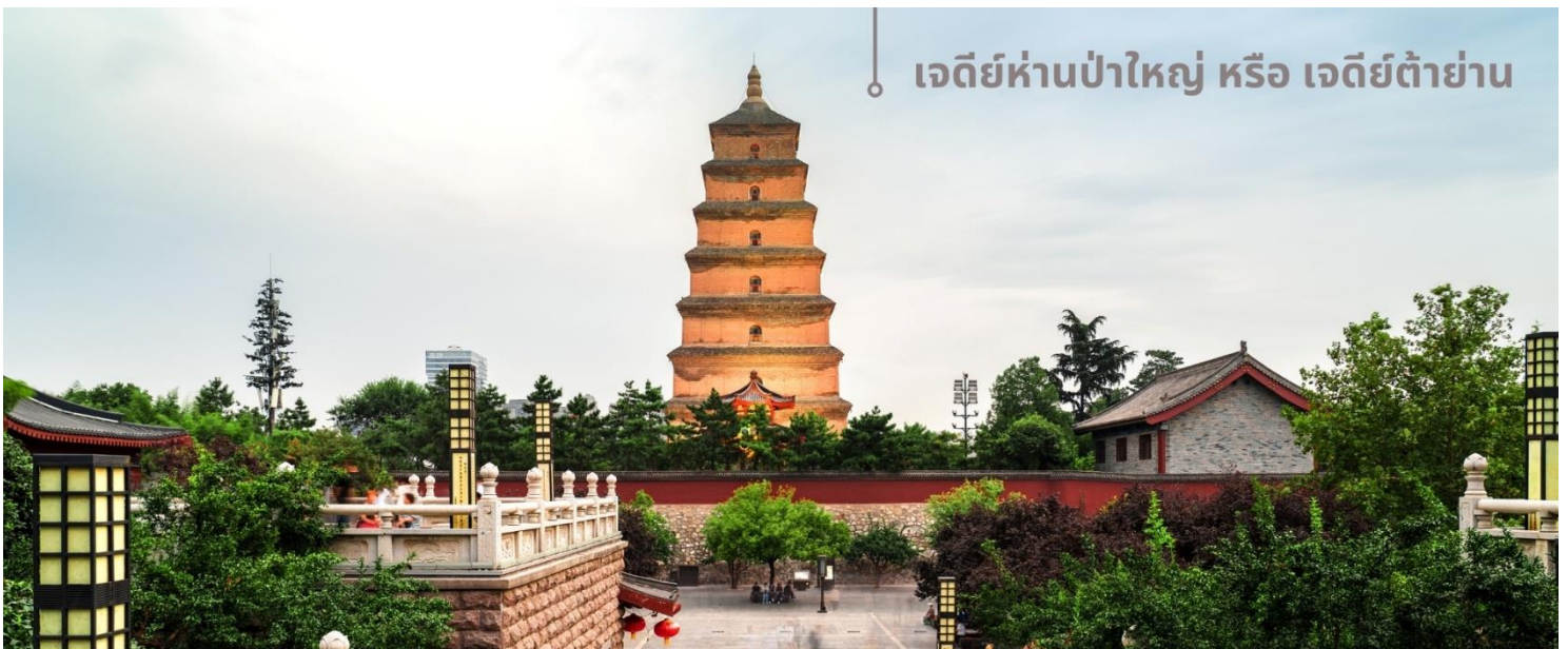
เจดีย์ห่านป่าใหญ่ หรือ เจดีย์ต้าย่าน

จากนั้นนำท่านเที่ยวชม เจดีย์ห่านป่าใหญ่ หรือ เจดีย์ต้าย่าน สถานที่ท่องเที่ยวระดับ 4A อายุมากกว่า 1,300 ปี ตั้งอยู่ในบริเวณวัดต้าฉือเอิน ซึ่งเป็นวัดสำคัญที่พระถังซำจั๋งเคยพำนัก ในตอนใต้ของเมืองซีอาน มณฑลส่านซี ตัวเจดีย์สร้างขึ้นใน