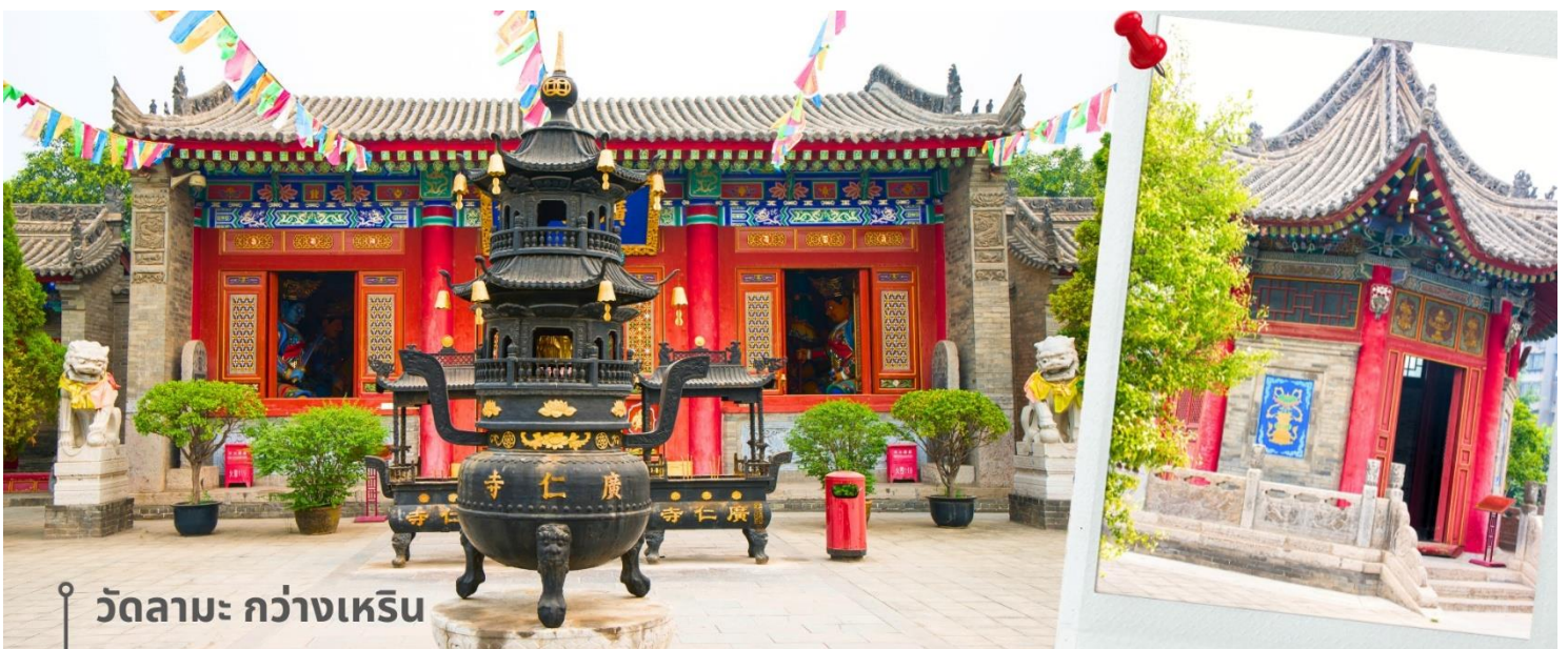
วัดลามะ กว้างเหริน

โดยเฉพาะประตูเซียนเหมิน (South Gate) ซึ่งมักใช้จัดงานแสดงและกิจกรรมพิเศษต่างๆ จากนั้นเดินทางต่อไปยัง วัดลามะกว้างเหริน เป็นวัดลามะแห่งเดียวในซีอาน สร้างขึ้นในปี ค.ศ.1705 ช่วงราชวงศ์ชิง เพื่อรองรับลามะจากทิเบตที่เดินทางมาพักแรมและประกอบพิธีกรรมทางศาสนา จุดเด่นของวัดคือสถาปัตยกรรมที่ผสมผสานสไตล์จีนและทิเบตอย่างงดงาม ภายในมีพระพุทธรูปและภาพจิตรกรรมฝาผนังที่วิจิตร รวมถึง "หอสมุดทิเบต" ซึ่งรวบรวมตำราทางพุทธศาสนาแบบทิเบตไว้ นักท่องเที่ยวสามารถสัมผัสบรรยากาศที่เงียบสงบและเรียนรู้เกี่ยวกับวัฒนธรรมทิเบตได้ที่นี้