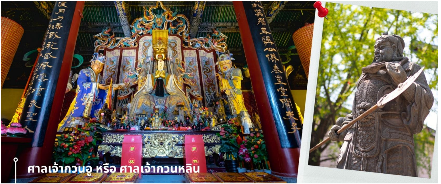
ศาลเจ้ากวนอู หรือ ศาลเจ้ากวนหลิน

นำท่านเที่ยวชม เมืองโบราณลั่วอี้ เป็นสถานที่ท่องเที่ยวระดับ 1A ตั้งอยู่ในเมืองเก่าของเมืองลั่วหยาง เมืองหลวงโบราณของราชวงศ์ทั้ง 13 ราชวงศ์ บรรยากาศอบอุ่นไปด้วยเสน่ห์แบบจีนโบราณ ที่ยังคงอยู่มายาวนานหลายร้อยปี เมื่อเดินเล่นผ่านเมืองโบราณลั่วอี้ จะเห็นสถาปัตยกรรมบ้านเรือน ที่มีชายคาซ้อนกันเป็นชั้นๆ และกำแพงเมือง สนามหญ้า