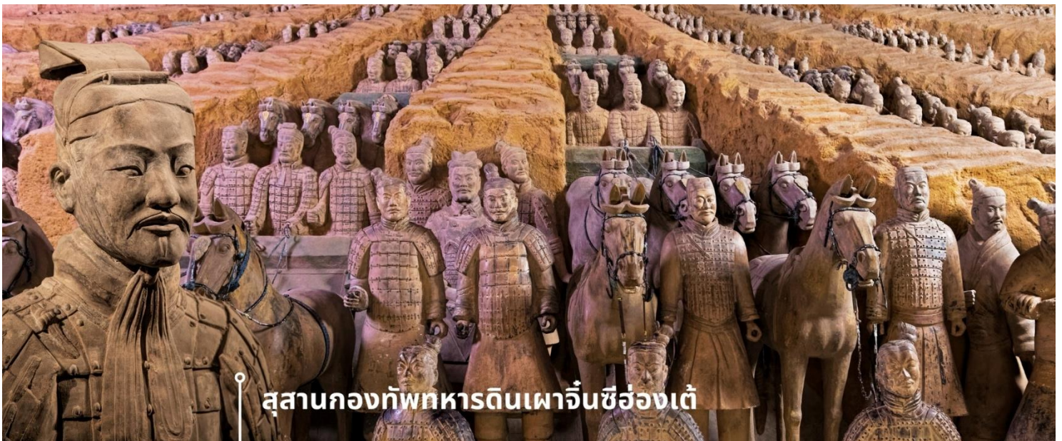
สุสานกองทัพทหารดินเผาจีนซีฮ่องเต้

คัมภีร์ของพระองค์ในโลกหน้า สุสานและกองทัพทหารดินเผาที่จึงเปรียบเสมือนการสะท้อนอำนาจของพระองค์ในยุคที่ยังมีชีวิต รวมถึงเป็นสัญลักษณ์แห่งความทะเยอทะยานของพระองค์ที่ไม่สิ้นสุดแม้ในความตาย สุสานกองทัพทหารดินเผาถูกค้นพบในปี ค.ศ. 1974 โดยชาวนาที่ขุดบ่อน้ำในเขตซีอาน มณฑลส่านซี หลังการค้นพบครั้งนั้น การขุดค้นและวิจัยทางโบราณคดีก็เริ่มต้นขึ้น ซึ่งทั้งหมดถูกจัดเรียงอย่างเป็นระเบียบในพื้นที่สุสานขนาดใหญ่ ภายในใช้เป็นสถานที่บรรจุพระบรมศพจีนซีฮ่องเต้ รวมไปถึงกองทัพทหารดินเผาที่มีจำนวนมากกว่า 8,000 ตัว แต่ละตัวมีขนาดเท่าคนจริง และยังมีม้าดินเผาอีกกว่า 600 ตัว พร้อมรถม้า และอาวุธต่าง ๆ ความน่าทึ่งอีกอย่างก็คือ ทหารดินเผาแต่ละตัวถูกปั้นขึ้นด้วยมือและมีรายละเอียดแตกต่างกันไป เช่น สีหน้า ทรงผม และเครื่องแต่งกาย ซึ่งสะท้อนยศและบทบาทของแต่ละคนในกองทัพ รวมถึงการเคลือบสีเพื่อให้รูปปั้นคงทนยาวนาน ซึ่งในปัจจุบัน สุสานแห่งนี้มีขนาดใหญ่ พื้นที่มากกว่า 56 ตารางกิโลเมตร ยังมีหลุมฝังศพหลัก และหลุมย่อยอีกมากมายที่ยังไม่ได้ถูกขุดค้น