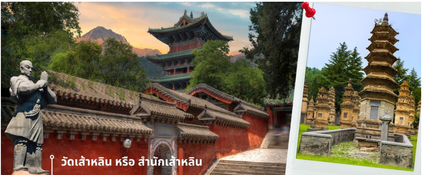
📍 วัดเส้าหลิน หรือ สำนักเส้าหลิน

นำท่านชม ปาเจติย์ หรือ ถ้ำหลิน ซึ่งมียู่อ่าว 230 ที่มีความเก่าแก่ เป็นสถานที่ศักดิ์สิทธิ์ที่ตั้งอยู่ภายในบริเวณวัด ซึ่งเป็น