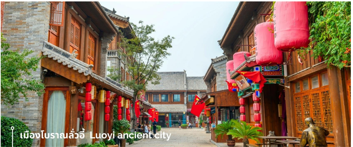
เมืองโบราณลั่วอี้ Luoyi ancient city

นำท่านเที่ยวชม เมืองโบราณลั่วอี้ เป็นสถานที่ท่องเที่ยวระดับ 1A ตั้งอยู่ในเมืองเก่าของเมืองลั่วหยาง เมืองหลวงโบราณของราชวงศ์ทั้ง 13 ราชวงศ์ บรรยากาศอบอุ่นไปด้วยเสน่ห์แบบจีนโบราณ ที่ยังคงอยู่มายาวนานหลายร้อยปี เมื่อเดินเล่นผ่านเมืองโบราณลั่วอี้ จะเห็นสถาปัตยกรรมบ้านเรือน ที่มีชายคาซ้อนกันเป็นชั้นๆ และกำแพงเมือง สนามหญ้า