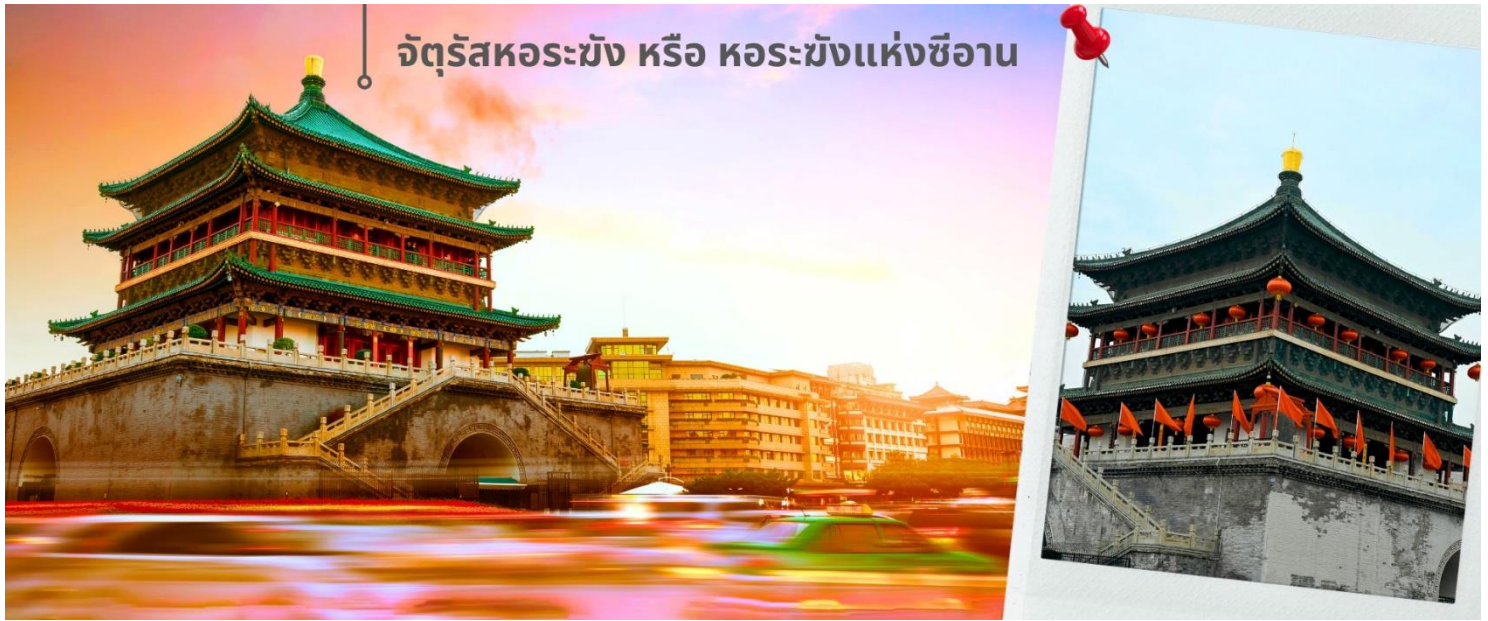
จัตุรัสหอรขัง หรือ หอรขังแห่งซีอาน

จากนั้นนำท่านเดินทางเที่ยวชม จัตุรัสหอรขัง หรือ หอรขังแห่งซีอาน เป็นหนึ่งในสัญลักษณ์สำคัญของเมืองซีอาน ตั้งอยู่ใจกลางเมือง สร้างขึ้นในปี ค.ศ. 1384 สมัยราชวงศ์หมิง เพื่อใช้ประกาศเวลาและเตือนภัยจากศัตรู ตัวหอสร้างจากไม้ทั้งหลัง มีความสูงประมาณ 36 เมตร โดดเด่นด้วยสถาปัตยกรรมจีนโบราณที่งดงาม และการประดับด้วยลวดลายสีทองและเขียว จัตุรัสแห่งนี้เป็นจุดตัดของถนนสายหลักทั้งสี่สาย สามารถขึ้นไปชมวิวเมืองซีอานแบบพาโนรามาได้ด้านบน