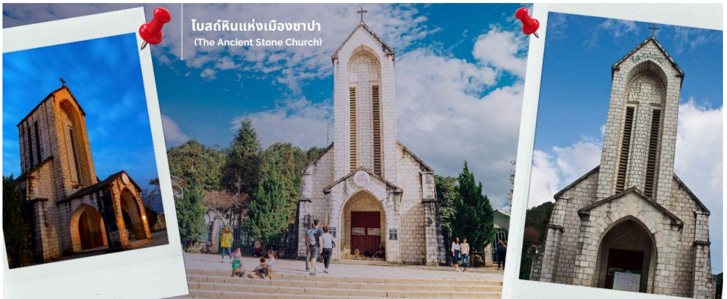
โบสถ์หินแห่งเมืองซาปา (The Ancient Stone Church)

นำท่านช้อปปิ้งที่ ตลาดไนต์เมืองซาปา มีสินค้าให้ท่านเลือกช้อปปิ้งมากมาย ไม่ว่าจะเป็นสินค้าพื้นเมืองของฝัก ขนหม กระเป๋า รองเท้า ท่านสามารถช้อปปิ้งได้อย่างจุใจ