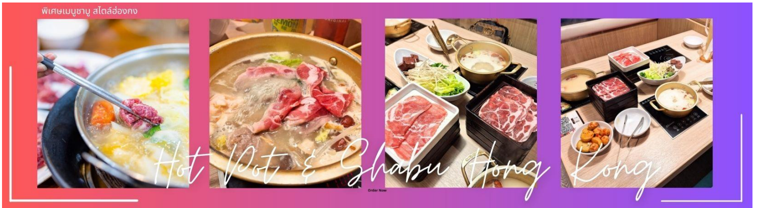
กลางวัน | 10 | บริการอาหารกลางวัน ณ ภัตตาคาร พิเศษ เมนูชาบู สไตส์ฮ่องกง (6)

จากนั้นนำท่านชม โรงงานจิวเวอรี่ ซึ่งเป็นโรงงานที่มีชื่อเสียงที่สุดของฮ่องกงในเรื่องการออกแบบเครื่องประดับ อาทิเช่น จี้ และแหวนกัณฑ์ ที่สวยงามโดดเด่นไม่เหมือนใคร ซึ่งถือกำเนิดขึ้นที่นี่และมีชื่อเสียงที่สุดใช้เป็นเครื่องประดับติดตัว และเสริมดวงชะตา สินค้าทุกชิ้นมีเอกสารรับประกันคุณภาพเปลี่ยน ซ่อม ได้ตลอดอายุการใช้งาน หากเกิดการชำรุดจากสินค้าไม่ใช่อุบัติเหตุ และนำท่านเลือกซื้อ เครื่องประดับที่ ร้านหยก ซึ่งคนจีนนั้นถือว่าหยกเป็นหิน ที่เป็นตัวแทนของความสวยงามและความบริสุทธิ์ มีความเชื่อว่าหยกมงคล ถ้าพกติดตัวไว้จะอายุยืนและสุขภาพดี