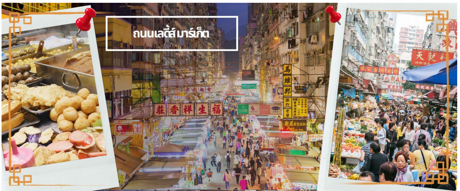
ถนนเลดี้ส์ มาร์เก็ต

จากนั้นนำท่านเดินทางสู่ ย่านมงก๊ก เป็นย่านที่มีความคึกคักที่สุดแห่งหนึ่งในเกาะฮ่องกงก็ว่าได้ เป็นสวรรค์ของนักช้อปปิ้งอีกหนึ่งที่ ที่สายช้อปปิ้งพลาดไม่ได้ นับได้ว่าเป็นย่านช้อปปิ้งที่คึกคักมากอีกแห่งหนึ่งของฮ่องกงเพราะเป็นย่านช้อปปิ้งที่มีทั้งร้านค้า และคนที่มาช้อปปิ้งจากที่ต่างๆ มากมายไม่ขาดสายตั้งแต่กลางวันยันกลางคืน เป็นถนนช้อปปิ้งที่มีสีสันมาก ถ้าเทียบกับญี่ปุ่นแล้วก็เปรียบเหมือนการเดินทางอยู่ที่ชิบูย่าเลยก็ว่าได้ และยังมี ถนนเลดี้ส์ มาร์เก็ต (LADIES MARKET) ที่มีทั้งเครื่องสำอาง เสื้อผ้า รองเท้า กระเป๋า เครื่องประดับมากมายให้เลือกช้อปปิ้ง อีกทั้งยังมีร้านอาหารและเครื่องดื่ม ที่