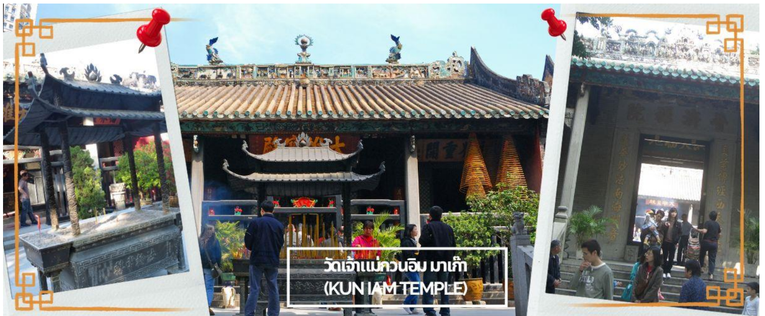
วัดเจ้าแม่กวนอิม มาเก๊า (KUNIAM TEMPLE)

นำท่านเดินทางสู่ วัดเจ้าแม่กวนอิม มาเก๊า (Kun lam Temple) เป็นหนึ่งในสามวัดเก่าแก่ที่สุดของมาเก๊า ถูกสร้างขึ้นระหว่างการครองราชย์ของจักรพรรดิฉานลี่ ในสมัยราชวงศ์หมิง ภายในเป็นที่ประดิษฐานของเทพเจ้าหลายองค์ รวมถึงองค์ที่มีชื่อเสียง นั่นก็คือ เจ้าแม่กวนอิม ซึ่งไม่เหมือนที่ไหนด้วยการแต่งเครื่องทรงชุดเจ้าสาวโบราณอย่างสวยงาม ผู้คนนิยมมาไหว้ขอพรให้มีความสุขและโชคดี รวมถึงการทำพิธีศักดิ์สิทธิ์เสริมสิริมงคลเรื่องเงินทอง สำหรับพิธีศักดิ์สิทธิ์ที่เรียกว่า “วันเปิดทรัพย์” เป็นพิธียิ่งใหญ่ประจำปีที่จะประกอบ พิธียืมเงินเจ้าแม่กวนอิม ซึ่งในหนึ่งปีจะมีฤกษ์ดีเพียงปีละครั้งเท่านั้น แต่ละปีอาจจะวันที่ไม่ตรงกัน โดยจะมีการคำนวณจากวันเวลาตามปฏิทินจีน ปกติแล้วฤกษ์