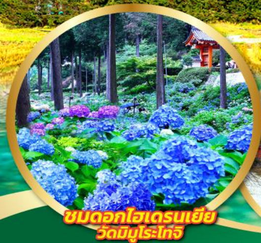
ชมดอกไม้เดรนเยี่ย วัดมิมุโรโงจิ