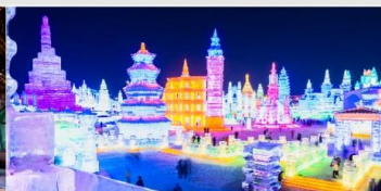
เทศกาลโคมไฟน้ำแข็ง