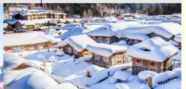
หมู่บ้านหิมะ

*ทางบริษัทฯ ขอสงวนสิทธิ์ในการสลับโปรแกรมทัวร์ตามความเหมาะสมขึ้นอยู่กับสถานการณ์หน้างาน โดยคำนึงถึงผลประโยชน์ของลูกค้าเป็นสำคัญ