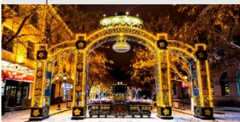
ถนนคนเดินจงหยาง