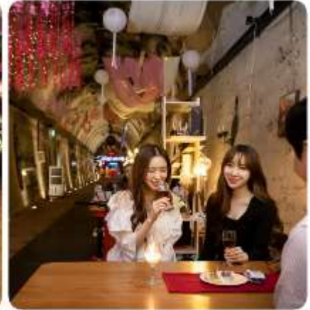
ตามใจชอบ

ถ้าไวน์แห่งกิมแฮ ไร่บอร์รี่พันธุ์ที่ถูกคัดสรรมาอย่างดี ผลิตผลทางการเกษตรที่ออกมาอย่างสมบูรณ์ในภูมิภาค และภูมิอากาศของกิมแฮ วัตถุประสงค์ตั้งต้นสุดพิเศษ เพื่อนำมาผลิตเป็นไวน์ชั้นเลิศ... กับสถานที่หมักไวน์ที่ไม่เหมือนที่ใดในโลก นั่นคืออุโมงค์แซงนิม อุโมงค์รถไฟที่ถูกทิ้งร้าง ถูกบูรณะและสร้างเป็นที่บ่มและเก็บไวน์ตลอดความยาว 215 เมตรของอุโมงค์แห่งนี้ ถูกตกแต่งและจัดสรรเป็นพื้นที่แห่งความสุข โดยมีทั้งหมู่บ้านสตอรี่บอร์รี่ของบอร์รี่ มาสคอตของอุโมงค์แห่งนี้ ที่เป็นเหมือนสวนสนุกเล็ก ๆ และพร้อมด้วยร้านจำหน่ายไวน์ไร่บอร์รี่ และไวน์อีกหลากหลายชนิดมีไว้ให้ชิม และเลือกสรร