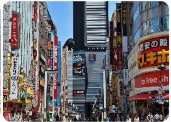
ช้อปปิ้งใจกลางกรุงโตเกียว - ซินจูกุ

นำพาทุกท่านเข้าสู่.. กรุงโตเกียว แวะช้อปปิ้งกันที่ใจกลางเมือง ซินจูกุ แหล่งรวมแฟชั่นและความบันเทิงย่านที่ไม่เคยหลับไหลและเต็มไปด้วยชีวิตชีวา และแหล่งช้อปปิ้งที่หลากหลาย เช่น Isetan และ Takashimaya ที่มีสินค้าหรูหราและแฟชั่นล่าสุด รวมถึงห้างสรรพสินค้าในตึกสูงอย่าง Tokyo Metropolitan Building เพลิดเพลินกับบรรยากาศที่สวยงามใสของ Kabukicho ซึ่งเป็นย่านบันเทิงที่มีร้านอาหารมากมาย นอกจากนี้ยังมี Golden Gai ซึ่งเป็นย่านบาร์เล็กๆ ที่มีเสน่ห์และบรรยากาศที่เป็นเอกลักษณ์ และมีแลนด์มาร์คถ่ายรูปที่โด่งดังอย่าง แมวยักษ์ 3 มิติ (Giant 3D Cat)