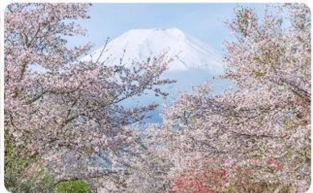
หมู่บ้านน้ำใสโอชิโนะ อักโก

โอชิโนะ อักโก หรือ ที่รู้จักกันในชื่อ หมู่บ้านน้ำใส ความงามแห่งธรรมชาติและวัฒนธรรมที่ซ่อนอยู่ใต้เงากุเขาไฟฟูจิโอชิโนะ อักโก ตั้งอยู่ในหมู่บ้านโอชิโนะ จังหวัดยามานาชิ ประเทศญี่ปุ่น เป็นแหล่งน้ำธรรมชาติที่มีชื่อเสียง ประกอบด้วยบ่อน้ำใสสะอาดทั้งแปดแห่ง ซึ่งน้ำใบบ่อเหล่านี้เกิดจากการละลายของหิมะและน้ำแข็งจากกุเขาไฟฟูจิ น้ำที่ไหลลงมานั้นได้ถูกรองผ่านชั้นหินกุเขาไฟเป็นเวลาหลายปี จนทำให้น้ำใบบ่อมีความบริสุทธิ์และใสจนเห็นถึงก้นบ่อ ไม่เพียงแต่ความงามของ