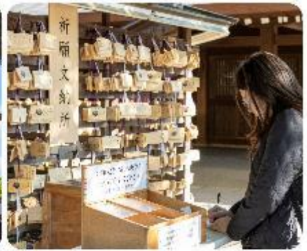
ศาลเจ้าเมจิจิงกู

ศาลเจ้าเมจิ หนึ่งในสถานที่อันศักดิ์สิทธิ์ใจกลางกรุงโตเกียว สิ่งแรกที่จะทำให้คุณประทับใจคือการเดินผ่านเสาโทริอิขนาดใหญ่ ระหว่างทางมีธรรมชาติที่ทำให้รู้สึกเหมือนก้าวเข้าสู่อีกโลกหนึ่ง ที่เต็มไปด้วยความสงบ อีกทั้งยังสามารถเขียนคำอธิษฐานลงบนแผ่นไม้ "เอมะ" เพื่อขอพรสำหรับความสุขและความสำเร็จในชีวิตอีกด้วย จากนั้นนำพาทุกท่าน...ช้อปปิงกันต่อใจกลางกรุงโตเกียว เมืองที่เป็นศูนย์กลางของแฟชั่นและนวัตกรรม และเปิดประสบการณ์การช้อปปิงที่ไม่เหมือนใคร! สักรายจ่ายต่าง ๆ ที่แต่ละแห่งที่มีเสน่ห์และเอกลักษณ์อันโดดเด่น เมืองที่เต็มไปด้วยชีวิตชีวาและความทันสมัยที่หลากหลายอย่าง ย่านฮาราจุกุ แหล่งรวมแฟชั่นที่แปลกใหม่และสดใส เดินเล่นบน Takeshita Street ที่เต็มไปด้วยเสื้อผ้าและเครื่องประดับที่ไม่ซ้ำใคร เพลิดเพลินกับบรรยากาศสุดคูลที่เป็นเอกลักษณ์