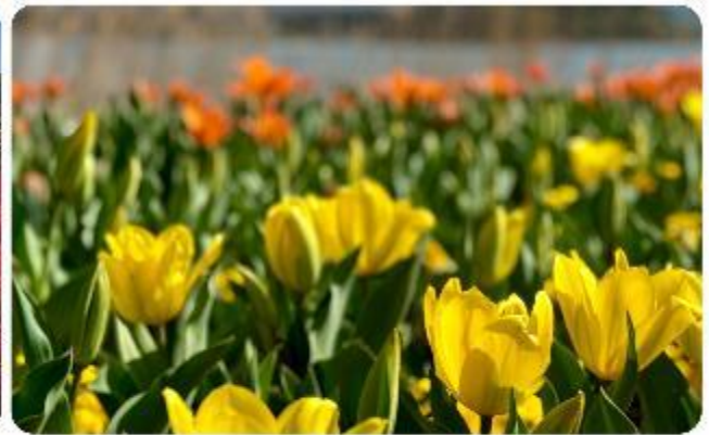
สวนโออิชิ ปาร์ค

สวนดอกไม้โออิชิ พาร์ค (Oishi Park) มหัตถุรย์แห่งวิวกุเขาไฟฟูจิ หนึ่งในจุดชมวิวกองกุเขาไฟฟูจิที่สวยงามที่สุดอีกจุดหนึ่ง ที่จะเติมเต็มความสงบและความงดงามของธรรมชาติในญี่ปุ่นเมื่อไปเยือน คือสถานที่ที่ไม่ควรพลาด สวนดอกไม้โออิชิ พาร์ค (Oishi Park) แห่งนี้ไม่ได้เป็นเพียงสถานที่ที่มีดอกไม้สวยงามให้เราชื่นชมแล้ว จุดเด่นของสวนนี้คือวิวกุเขาฟูจิที่อยู่เบื้องหลังสวนดอกไม้สีสันสดใส ที่บานสะพรั่งในทุกฤดูกาล และยังเป็นมุมที่เราได้สัมผัสกับวิวกุเขาฟูจิได้อย่างใกล้ชิด จากนั้นนำพาทุกท่านสู่..