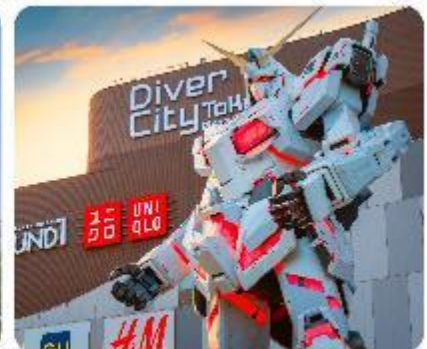
ย่านโอไดบะ ห้างไดเวอร์ซิตี ODAIBA SEASIDE PARK