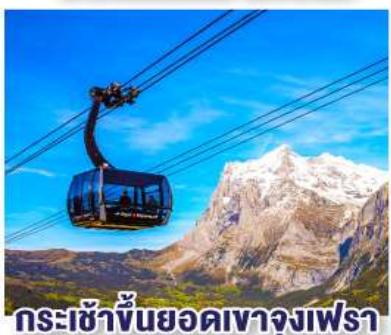
กระเช้าขึ้นยอดเขาจุงเฟรา