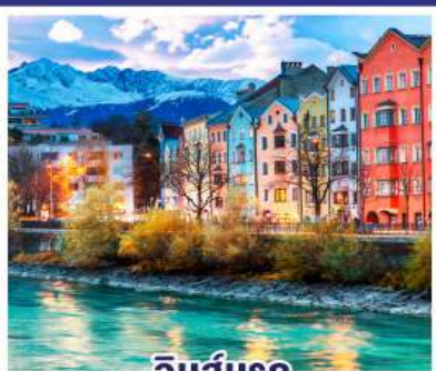
อินส์บรุค