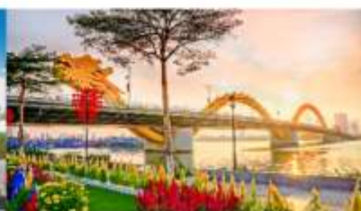
สะพานมังกร

*กรณีห้องพักบานาฮิลล์เต็ม ขอสงวนสิทธิ์ในการเปลี่ยนวันเข้าพัก และปรับเปลี่ยนโปรแกรมโดยคำนึงถึงผลประโยชน์ลูกค้าเป็นสำคัญ