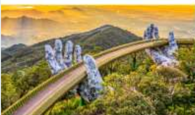
บานาฮิลล์