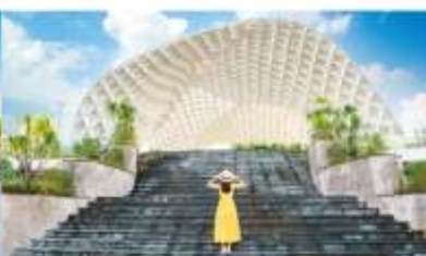
สวนเอเปค