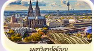
มหาวิหารโคโลญ