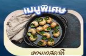
ของแถมพิเศษ

เดินทาง 9 - 16 พ.ค.68 19 - 26 พ.ค.68 26 พ.ค. - 2 มิ.ย.68