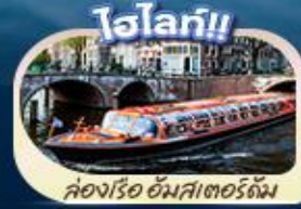
ล่องเรือ อัมสเตอร์ดัม

“ตำนานเด็กยีนส์ สัญลักษณ์แห่งกรุงบรัสเซลส์ แมนเนเกน พิส มหาวิหารโคโลญ” สะพานไอเอ็นซอลาสิร์น ล่องเรือชมหมู่บ้านทีโรน กังหันลมชานส์สคันส์ คลองอัมสเตอร์ดัม บรัสเซลส์ อดิเมียม จตุรัสบรูจส์ หอไอเฟล จตุรัสคองคอร์ด พิพิธภัณฑ์ลูฟร์ ล่องเรือแม่น้ำแซน ซุปปิงแบบบจูกีห่างชั้นนำ