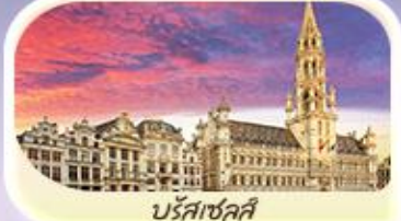
บรัสเซลส์