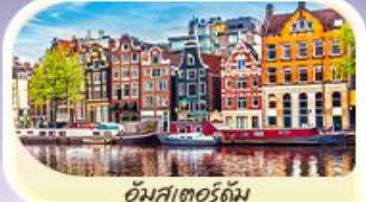
อัมสเตอร์ดัม