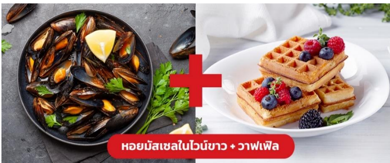
หอยมัสเซลในไวน์ขาว + วาฟเฟิล

เย็น ๑๐ รับประทานอาหารเย็น (มื้อที่10) เมนูพิเศษ!! หอยมัสเซล + วาฟเฟิล (Mussel in White wine + Waffle)