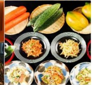
Hotel Art Stay Naha Kokusai-Dori