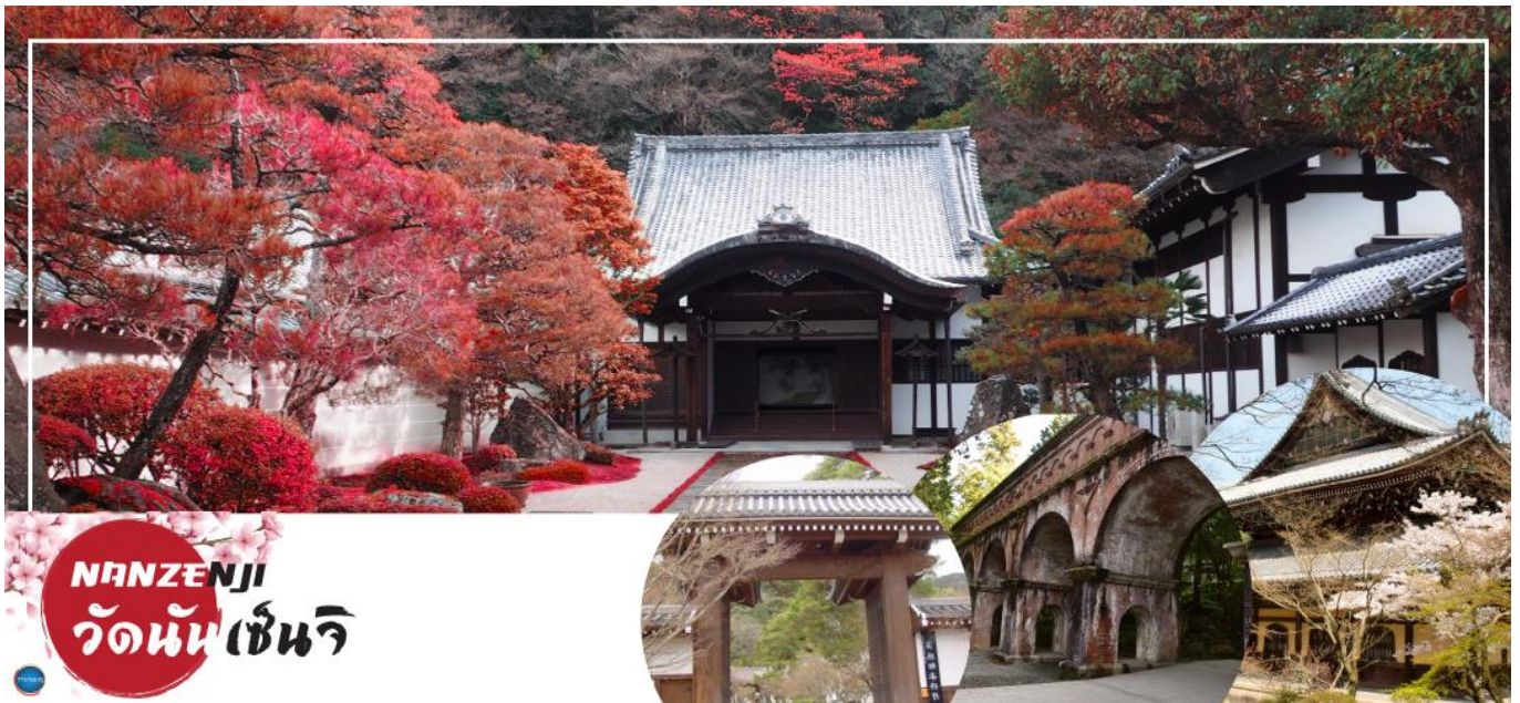
NANZENJI วัดนันเซ็นจิ

เมืองโอซาก้า – เมืองเกียวโต – วัดนันเซ็นจิ – การเรียนพิธีชงชาญี่ปุ่น – วัดกินคะคุจิ หรือ วัดเงิน – ถนนสายนักปราชญ์ – เมืองโอซาก้า – ซัปโปงชินไซบาชิ