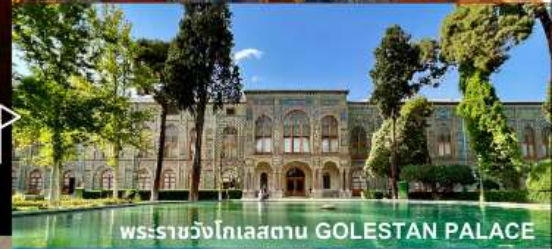
พระราชวังโกเลสถาน GOLESTAN PALACE