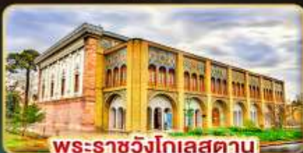
พระราชวังโกเลสถาน