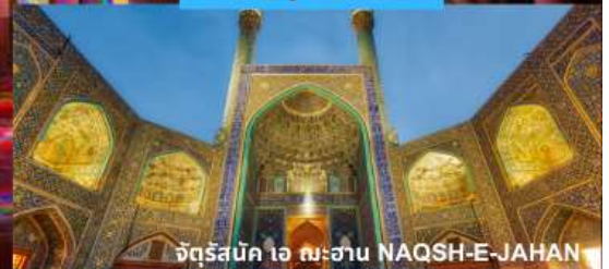
จัตุรัสนัก ๑๖ ณะฮาน NAQSH-E-JAHAN