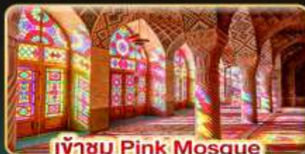
เข้าชม Pink Mosque