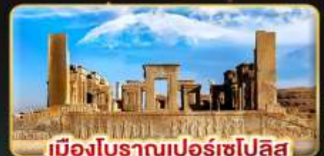
เมืองโบราณเปอร์เซโพลิส