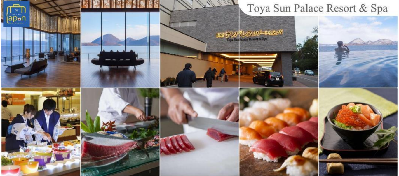
Toya Sun Palace Resort & Spa

--หลังอาหารให้ท่านได้ผ่อนคลายกับการแช่น้ำแร่ธรรมชาติ เชื่อว่าถ้าได้แช่น้ำแร่แล้ว จะทำให้ผิวพรรณสวยงามและช่วยให้ระบบหมุนเวียนโลหิตดีขึ้น--