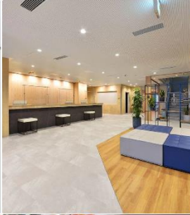
Hotel Flexstay Hakodate Ekimae