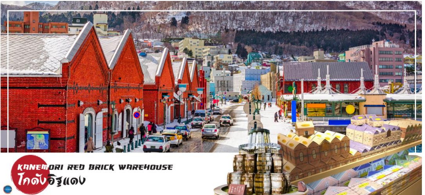
KANEMORI RED BRICK WAREHOUSE โกดังอิฐแดง

เมืองฮาโกดาเตะ – ตลาดเช้าฮาโกดาเตะ – โกดังอิฐแดง – ย่านเมืองเก่าโมโตมาชิ – ป้อมโกเรียวกาคู (เช้าชม) – ทะเลสาบโทยะ – ออนเซน