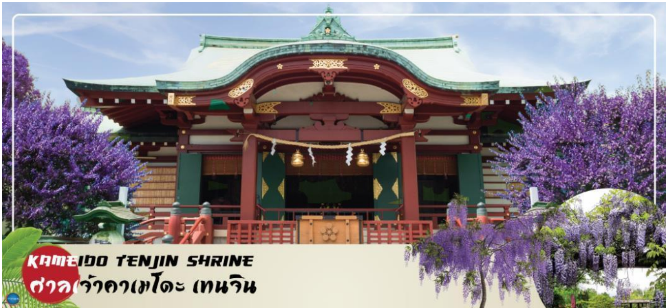
KAMEIDO TENJIN SHRINE ศาลเจ้าคาเมโตะ เทนจิน

กรุงโตเกียว – ศาลเจ้าคาเมโตะ เทนจิน (จุดชมดอกวิสทีเรียขึ้นอยู่กับสภาพอากาศ) – ไทโฮสุ เซนเคียวคุ บันไร – ชมแมวยักษ์ 3 มิติ พร้อมช้อปปิ้งย่านชินจูกุ – เมืองนาริยะ