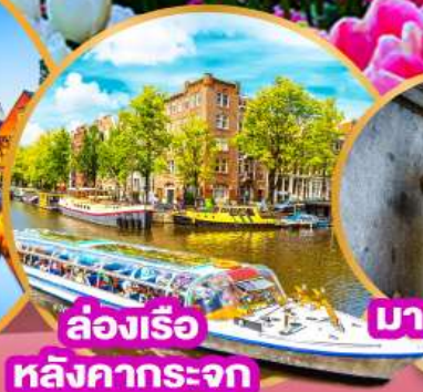
ล่องเรือ หลังคากระเจก