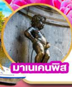
มานเคนพิส