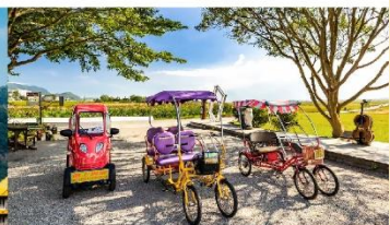
ปั่นจักรยานเล่นที่ Mr. Brown Avenue

*ทางบริษัทฯ ขอสงวนสิทธิ์ในการสลับโปรแกรมทัวร์ตามความเหมาะสมขึ้นอยู่กับสถานการณ์หน้างาน โดยคำนึงถึงผลประโยชน์ของลูกค้าเป็นสำคัญ