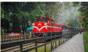
อุทยานแห่งชาติอลีสาน