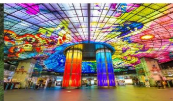
Dome of Light