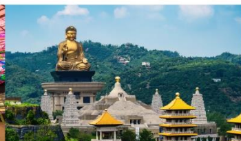
วัดฟอกวงซาน