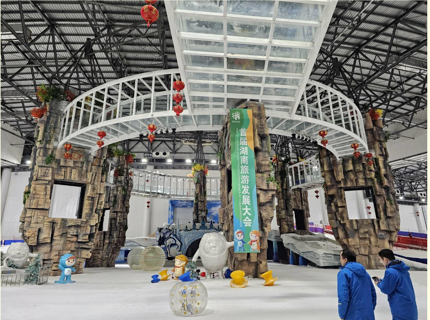
ด้วยหิมะตลอดทั้งปี

นำท่านไป ZHANGJIAJIE ICE AND SNOW WORLD ดินแดนหิมะที่มีพื้นที่กว่า 200 ไร่ ภายในถูกปกคลุมไปด้วยน้ำแข็งและหิมะ มีกิจกรรมหลากหลาย เช่น สกี, สโนวบอร์ด, การเล่นหิมะ, สเก็ต, BUMPER CAR และอื่น ๆ อีกมากมาย และยังมีการแสดง FANTASTIC SNOW WORLD ให้ท่านสัมผัสบรรยากาศที่เต็มไปด้วย