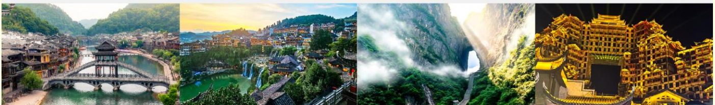
เมืองโบราณเพ็งหวง