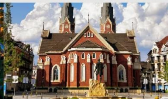
หมู่บ้านจำลองลูเซิร์น