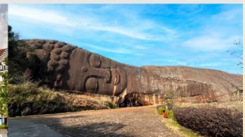
พระนอนอีหยาง

*ทางบริษัทฯ ขอสงวนสิทธิ์ในการสลับโปรแกรมทัวร์ตามความเหมาะสมขึ้นอยู่กับสถานการณ์หน้างาน โดยคำนึงถึงผลประโยชน์ของลูกค้าเป็นสำคัญ