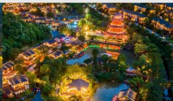
หมู่บ้านเกอเซียน