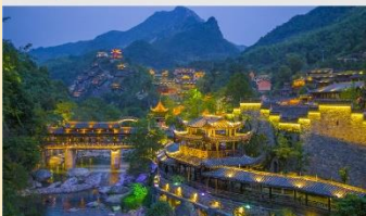
หุบเขาเทวดาวังเซียนตุ๋