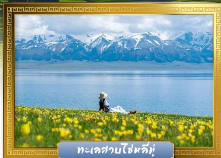
ทะเลสาบไซหลิมู่