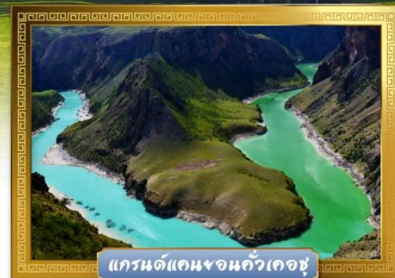
แกรนด์แคนยอนคั่วเคอซู

เดินทางโดย : สายการบินโซนาเซาเทิร์นแอร์ไลน์