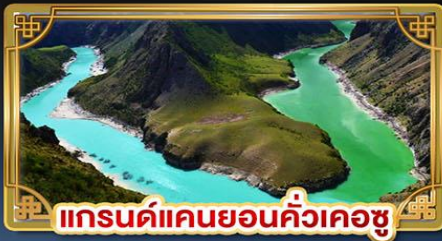
แกรนด์แคนยอนคั่วเคอซู