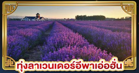
ทุ่งลาเวนเดอร์อิฟาอ้อฮัน