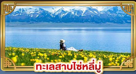
ทะเลสาบไซหลี่มู่