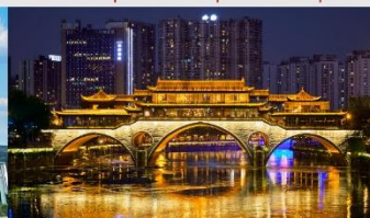
สะพานอันซุน