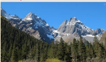
ภูเขาสี่ดรุณี (หุบเขาชวงเจียวโกว)