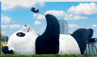
รูปปั้นหมีแพนด้าอนเซลฟ์