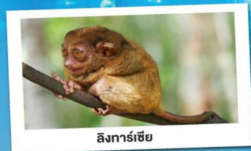
ลิงทาร์เซียร์