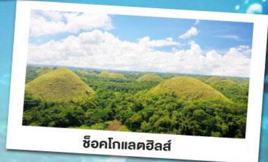
ช็อคโกแลตฮิลล์