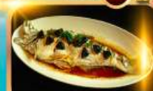
ปลาประจานริบตี