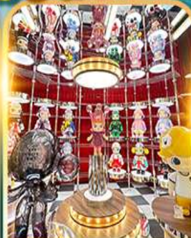
POP MART ซีเหมินติง