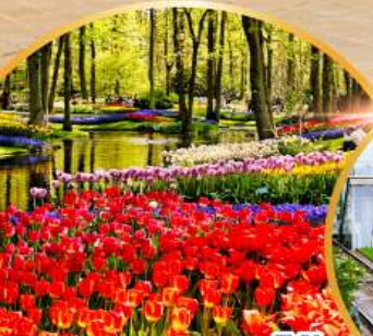
เทศกาลดอกไม้ เคอเคนฮอฟ