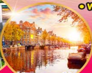
อัมสเตอร์ดัม