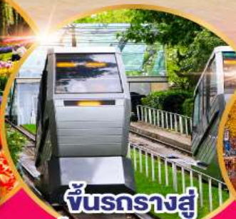
ขึ้นรถไฟสู่ ย่านมงมาร์ต