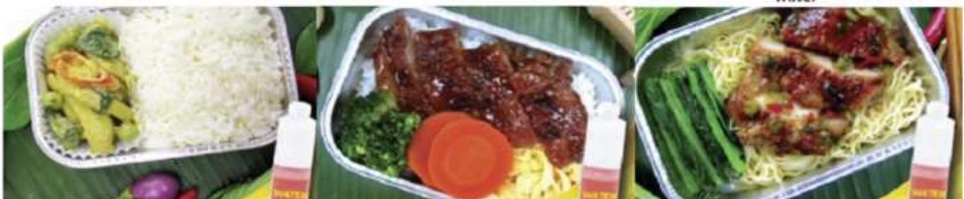
Chicken roasted with herb and noodle and water