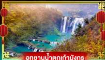
อุทยานน้ำตกเก้ามังกร