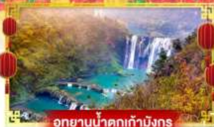
อุทยานน้ำตกเก้ามังกร