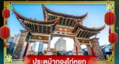
ประตูม้าทองไถ่หยก