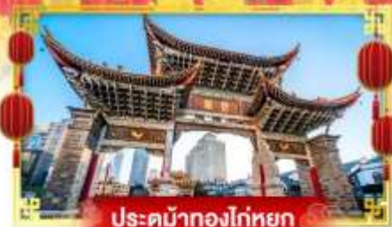
ประตูม้าทองโก่หยก