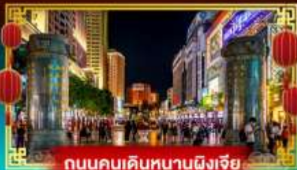
ถนนคนเดินหนานผิงเจีย

“ชมเทศกาลดอกไม้บ้านคนนึ่ง” เที่ยวอุทยานน้ำตกเก้ามังกรสุดอลังการ