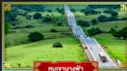
หุบเขานางฟ้า