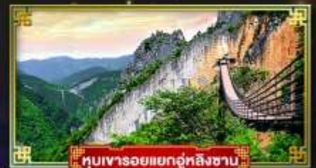
หุบเขารอยแยกอู่หลงซาน