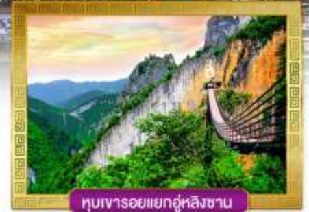
หุบเขารอยแยกอู่หลิงซาน