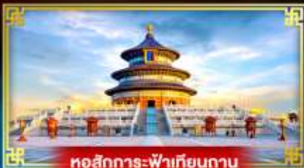
หอสักการะฟ้าเทียนถาน