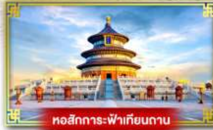
หอสักการะฟ้าเทียนถาน