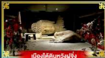
เมืองใต้ดินหวู่ฟู่จิ้ง