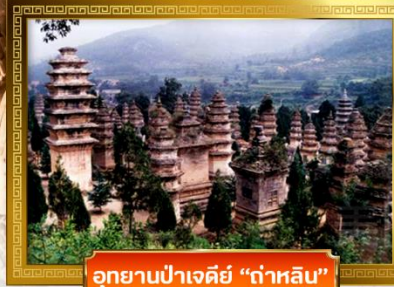
อุทยานป่าเจดีย์ "ต้าหลิน"