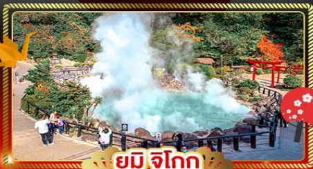
♨️ ยูมิจิกุ