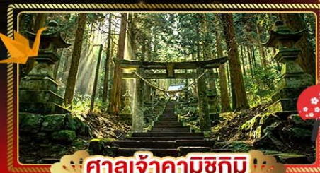
🌲 ศาลเจ้าคามิชิกิ