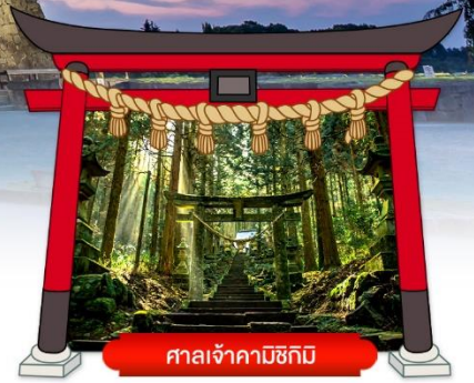
ศาลเจ้าคามิซึกิมิ