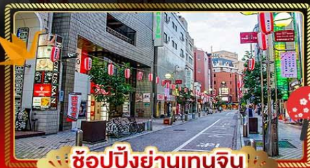
🛍️ ช้อปปิ้งย่านเทนจิน