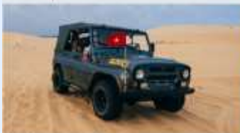
ทะเลทรายขาว