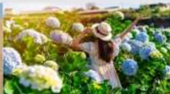
สวนดอกไฮเดรนเยีย