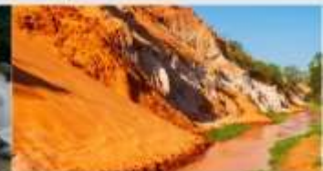
ล้ำธารนางฟ้า

*ทางบริษัทฯ ขอสงวนสิทธิ์ในการสลับโปรแกรมทัวร์ตามความเหมาะสมขึ้นอยู่กับสถานการณ์ปัจจุบัน โดยทำปิ้งถึงผลประโยชน์ของลูกค้าเป็นหลัก