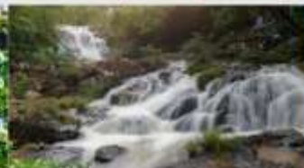
น้ำตกดาตันลา