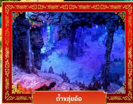
ถ้ำสุ่ยอ้อ