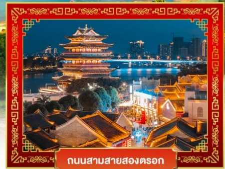
ถนนสามสายสองตอ