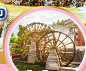
เมืองโบราณ ลี่เจียง