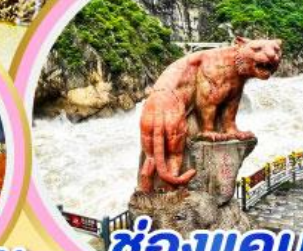
ช่องแคบ เสือกระโจน