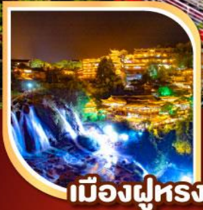
เมืองฝูหลง