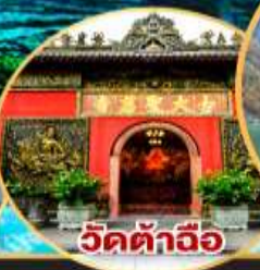
วัดต้าฉิว