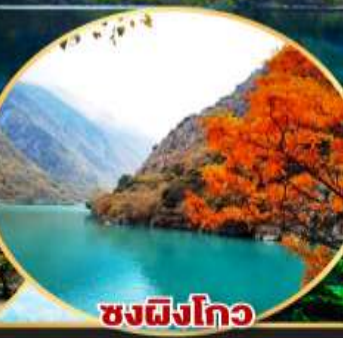
ชงผิงโกว