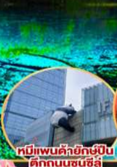
หมีแพนด้ายักษ์ปิ่น ดึกกบนซุนซีสู