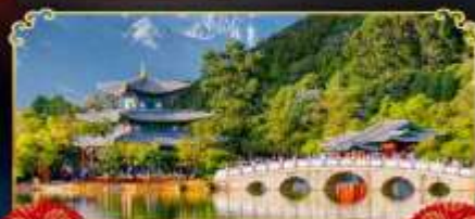
สระมิงกรต้า