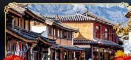
เมืองโบราณไป๋ชา