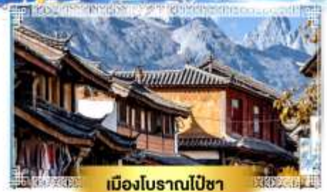
เมืองโบราณไปซา