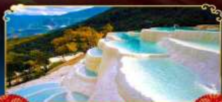
ไป๋ซู่โก

นั่งกระเช้าขึ้นหุบเขาพระจันทร์สีน้ำเงิน ชมวิว "นาผาไห่" ทะเลสาบทุ่งหญ้าที่ดีที่สุด