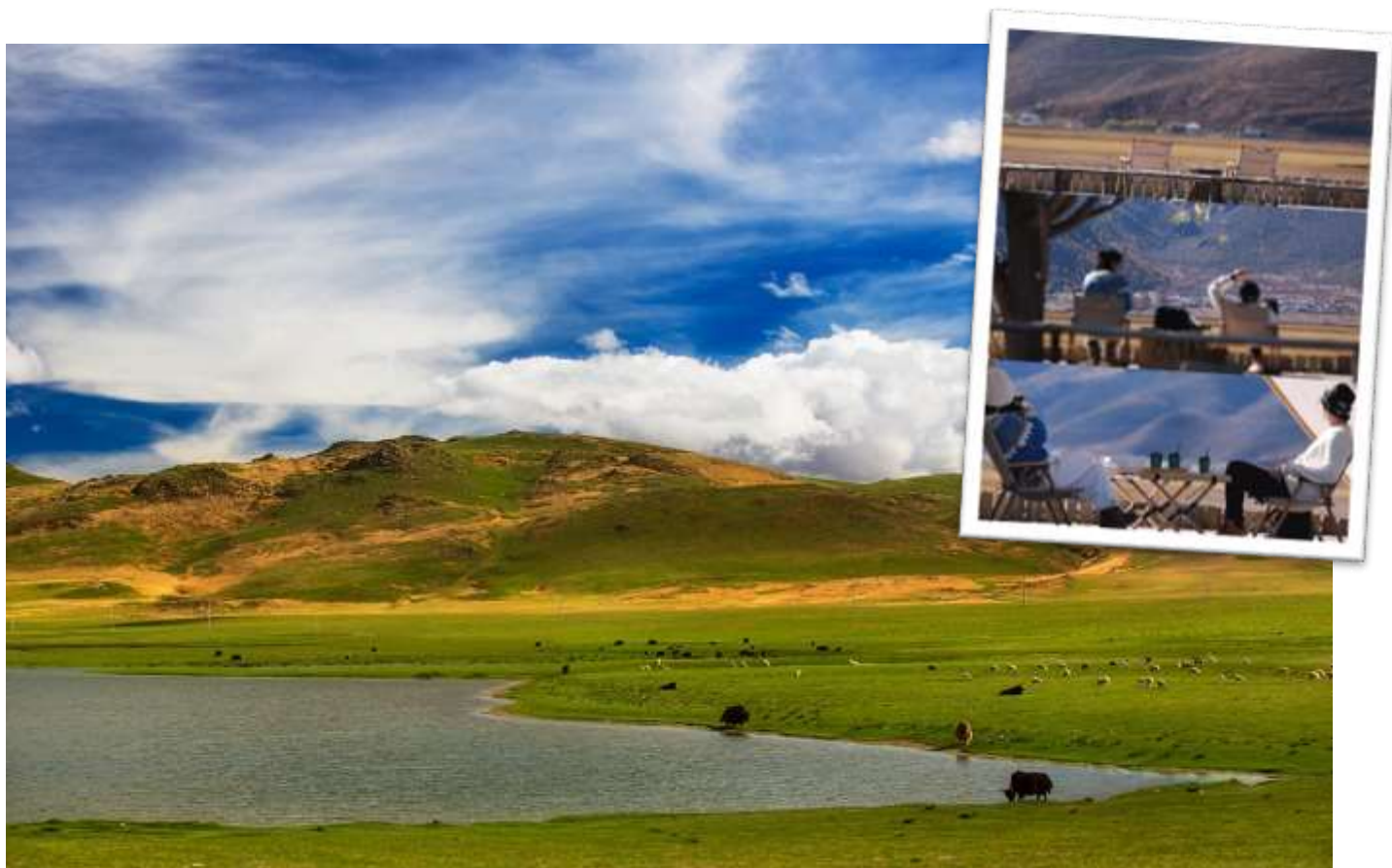
หมายเหตุ: ทิวทัศน์ขึ้นอยู่กับฤดูกาลและสภาพอากาศ

ล้อมทะเลสาบ นอกจากนี้ ยังสามารถเช่าชุดพื้นเมืองทิเบตมาใส่ถ่ายรูปที่นี่ได้อีกด้วย และแวะถ่ายรูปเซคอินซิมกาแพที่คาเฟ่ BLACK BEAN COFFEE HOUSE (ไม่รวมค่าเครื่องดื่ม)