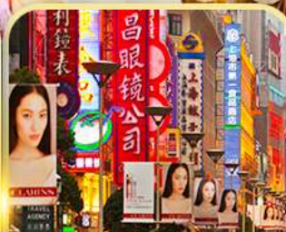
เดินเล่นถนนหนานจิง