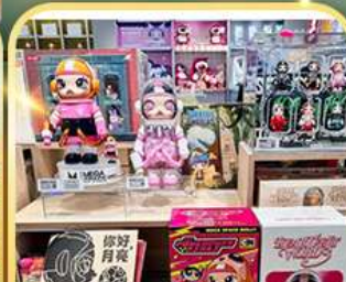
Popmart ห้างหูปิ่น อิน77