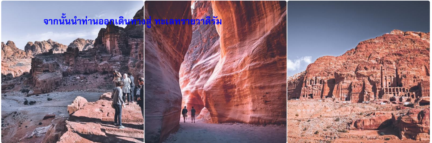
จากนั้นนำท่านออกเดินทางสู่ ทะเลทรายวาดีรัม

จากนั้นจะเป็นถนนเข้าเมือง หรือที่เรียกว่า THE SIQ เป็นช่องทางเดินที่ขนานสองฝั่งด้วยหน้าผา กว้างกว่า 1.5 กิโลเมตรที่เกิดจากการแยกตัวของเปลือกโลกและการซัดเซาะของน้ำเมื่อหลายล้านปีก่อน ส่วนใหญ่ทางเดินร่วมๆ สบายๆ (ทางเดินค่อนข้างลาดลง ไม่เหนื่อย ระหว่างทางก็มีมุมสวยๆ ให้เก็บภาพเรื่อย ๆ และมีบรรดานักมาขายของที่ระลึก เดินชมความสวยงามของผาหินสีชมพูสูงชันทั้ง 2 ข้างคล้ายกับแคนยอนน้อย ๆ และ สิ่งก่อสร้าง รูปปั้นแกะสลัก ต่างๆ