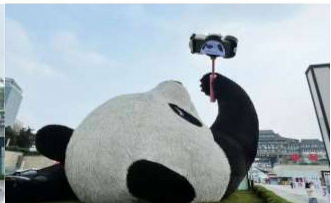
GO1CNXTFU-EU001 บินตรง เชียงใหม่ เฉิงตู จิวจ้ายโกว ภูเขาสี่ตรุณี 6วัน 5คืน (EU)