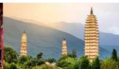
เจดีย์สามองค์