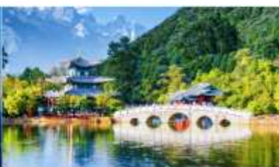
สระมิงกรดำ