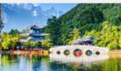
สระมิงกรต้า