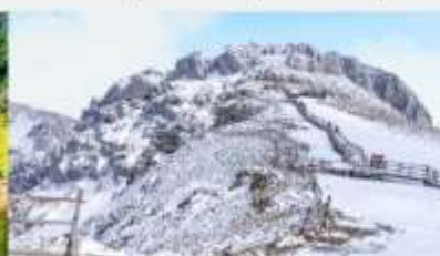
ภูเขาหิมะสี้อ่า