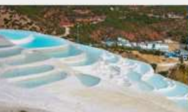
ระเบียงธารน้ำขาว "ไป๋สุ่ยโต"