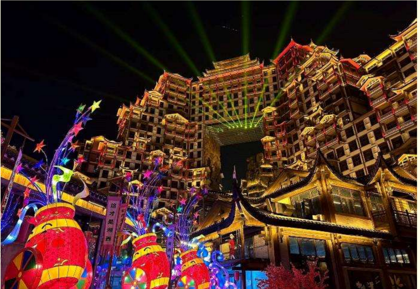
ระลึก ที่ตกแต่งด้วยแสงสีสุดอลังการ

นำท่านชม ตึกมหัศจรรย์ 72 แห่งเมืองจางเจียเจีย แลนด์มาร์คใหม่ล่าสุดที่เป็นเสมือนแม่เหล็กดึงดูดนักท่องเที่ยวและผู้มาเยือน ถูกสร้างขึ้นโดยนำเอาจุดเด่นของเมืองจางเจียเจียมารวมกัน โดยมีอาคารสูงที่สร้างจำลองถ้ำประตูสวรรค์ บ้านยกพื้นโบราณที่เป็นบ้านพื้นเมืองของชาวตู่เจีย นอกจากนี้ ที่นี่ยังถูกออกแบบให้กลายเป็นแหล่งรวมของ รีสอร์ท โฮมสเตย์ ร้านอาหาร แผงสตรีทฟู้ด ผับบาร์ ร้านขายของที่