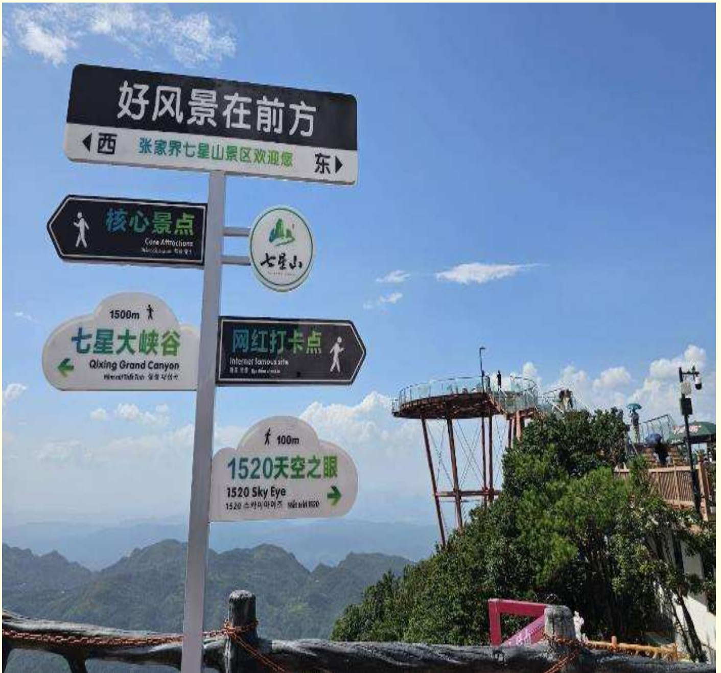
ระดับน้ำทะเล 1,528 เมตร บนยอดเขามียอดเขาสูงกว่า 7 ยอด

นำท่านสู่ ภูเขาเจ็ดดาว (รวมกระเช้าขึ้น-ลง) เป็นที่เที่ยวใหม่จางเจียเจีย เป็นกลุ่มยอดเขาสูงทอดยาวข้ามแม่น้ำหลี่สือรวากับกำแพงกันหินหมู่เขา บริเวณจุดชมวิวของภูเขาเจ็ดดาวจะสามารถมองเห็นยอดเขาที่ยืนเหนือนานได้ภูเขาล้อมรอบด้วยหน้าผา มีความสูงเฉลี่ย 1,400 เมตร และยอดเขาที่สูงที่สุดอยู่สูงจาก